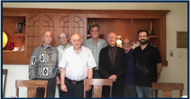
Réunion des Eudistes du Nouveau Brunswick

Abituato all'animazione, è stato assegnato dal 1997 al 1999 come Responsabile dell'équipe di sacerdoti incaricati di questo servizio, per essere poi cappellano presso l'Accueil Notre Dame, poi cappellano dell'Hospitalité Notre Dame de Lourdes dal 2012 al 2015.